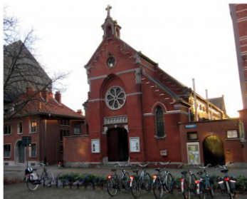
Locatie zalen op de buitenring rond Leuven