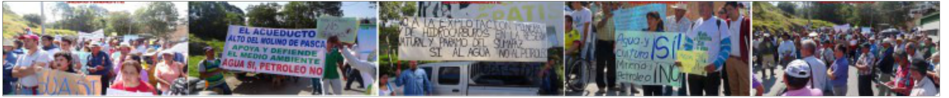
Foto's van de manifestatie tegen de petroleumbedrijven