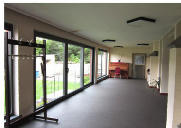
Terras achter de kerk 40,26 m 2