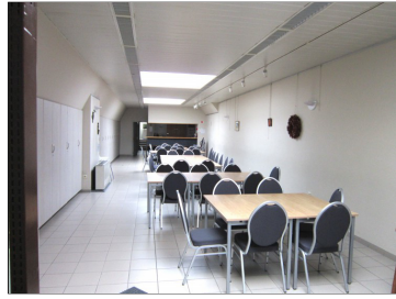
Kristoffelzaal naast de kerk met bar 92 m 2