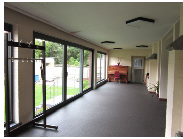
Terras achter de kerk 40,26 m 2