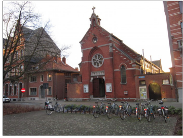
Locatie zalen op de buitenring rond Leuven

Locatie: Léon Schreursvest 33 te 3001 Heverlee. Alle zalen kunnen in combinatie met de keuken gereserveerd worden voor ontmoetingen, koffietafels en feesten (geen fuiven). Meer info en reservatie: Hubert.gorissen@telenet.be 0473 88 21 73