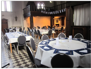
Antoniusruimte achter de kerk met bar 122,40 m 2