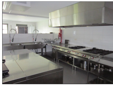
Volledig uitgeruste keuken. Kookgedeelte