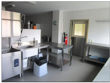
Volledig uitgeruste keuken. Afwasgedeelte