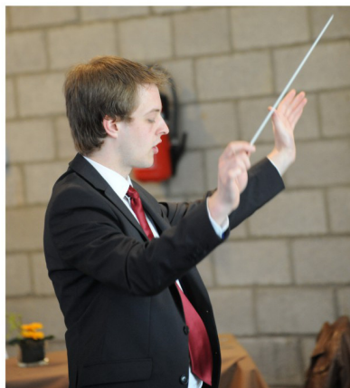
Een enthousiaste dirigent

Dan volgt een sprankelende receptie met de Concertband die in dit centrum repetitie houdt