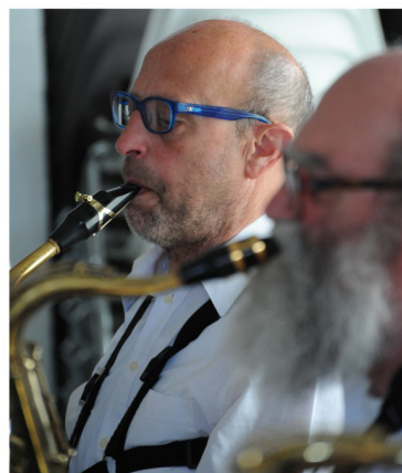
En even enthousiaste muzikanten