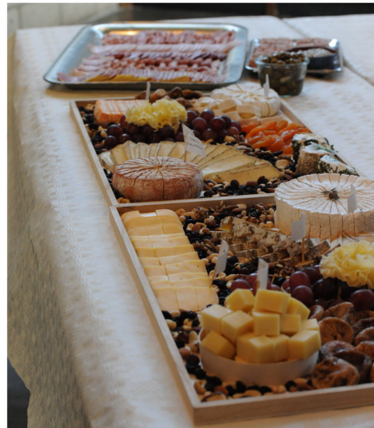
De mooi geschikte schotels staan uitnodigend klaar