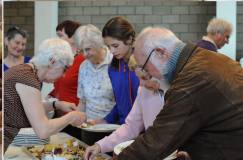
Aanschuiven maar en uitkiezen

Dank aan de lieve mensen met hun goede zorgen