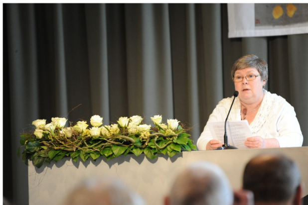
Viering met als thema: Opstaan. Elke dag Lees de viering op bladzijde 3

Dan volgt een sprankelende receptie met de Concertband die in dit centrum repetitie houdt