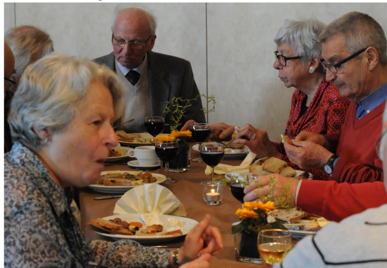
Gezellig aan tafel, gezellig gebabbel, een deugddoende ervaring