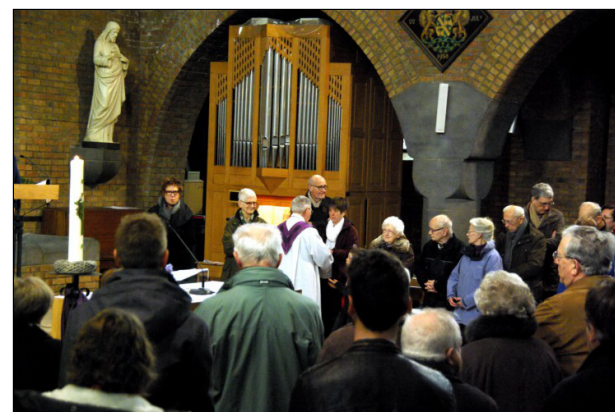
Ik wil de steen laten vallen die me afsluit van de noden van de wereld.