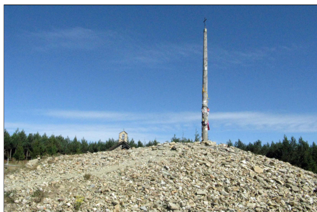
Onderweg op hun pelgrimstocht naar Santiago passeren de honderden pelgrims dus het 'Cruz de Ferro', het 'kruis van bevrijding'. Misschien vol met blaren aan de voeten maar zeker met een bevrijd hart laten ze hier hun steen achter.