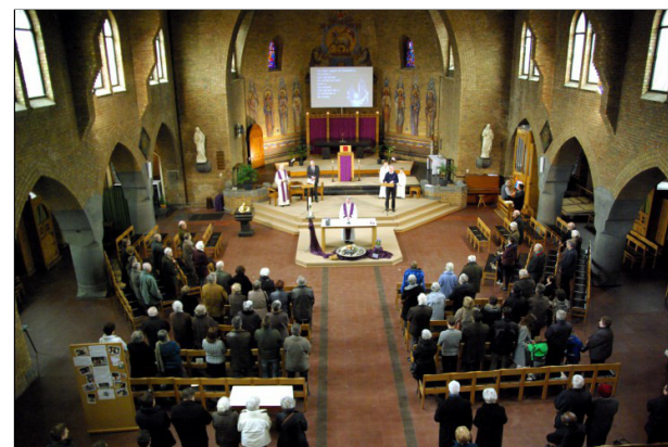
Wees hier aanwezig, woord ons gegeven, dat ik U horen mag met hart en ziel. Wek uw kracht en kom ons bevrijden.