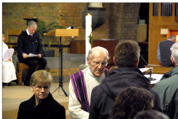
Ik wil de steen laten vallen, de steen van harde woorden.