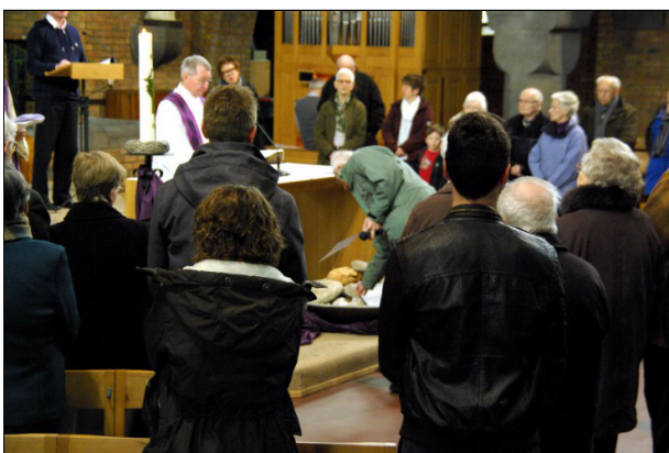
Samen het verzoeningsmoment beleven. Ik wil de steen laten vallen, de steen van mijn pretentie, mijn almacht.