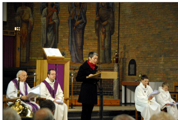
...met anderen, dichtbij en veraf.