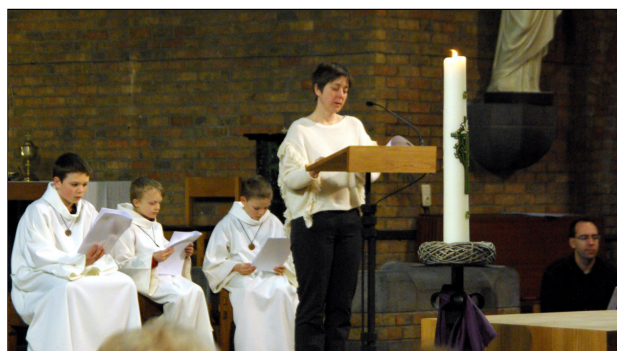
Laten we even naar de wereld kijken en samen zien dat elke kleine stap de moeite waard kan zijn. We willen ontsnappen uit een negatief bestaan van verspilling van levengevend water en durven kijken naar wat voor ons ligt.