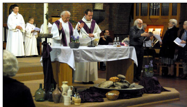
Wij danken U voor het spoor dat Hij getrokken heeft. Wij mogen voor U zijn: mensen onderweg, die, in het licht van uw evangelie, veertig dagen lang opgaan naar Pasen.