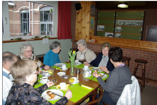
.... van 8 tot 9.40 uur.