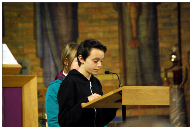
...in ons leven mogen we heel wat geluk ervaren. Dit beseffen we niet altijd.