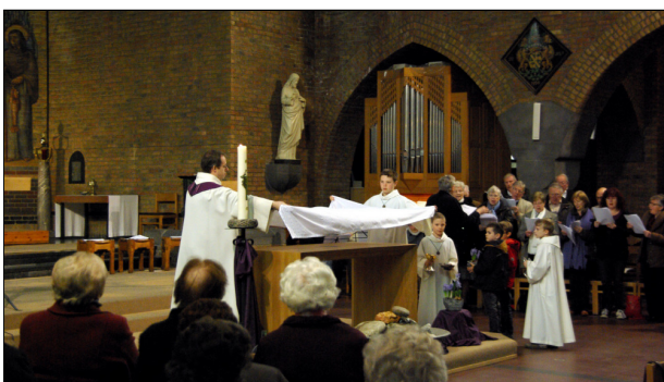
Het brood en de wijn zijn teken van overvloed en vruchtbaarheid. Wij zeggen U dank, God, voor deze gaven die we kregen uit uw hand. Ze zijn vrucht van werken en rusten, van eerbied en respect.