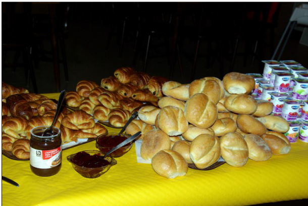
...ten voordele van LET US CHANGE....