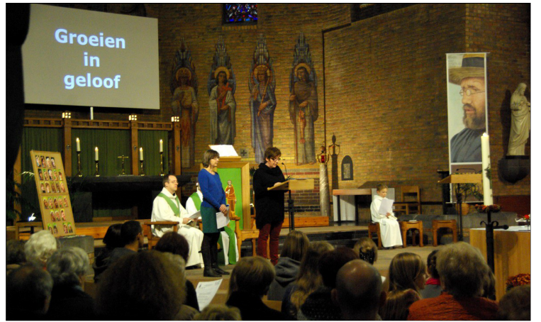
Goede God, het is niet gemakkelijk te kiezen voor onze kinderen.

God volgt mij, ongezien, op mijn verdere levensweg. Ik mag op Hem vertrouwen. Hij schenkt me zijn Geest van licht en sterkte.